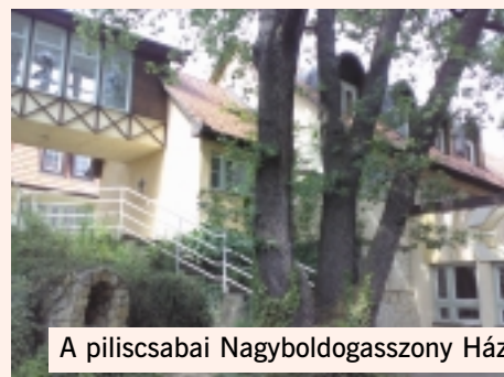
A piliscsabai Nagyboldogasszony Ház

Jászai Joli néni születésnapja 1907. május 21-én 20-án dédunokája Ludovik Áron 2007. május 21-én 2007. május 21-én 2. kiadás